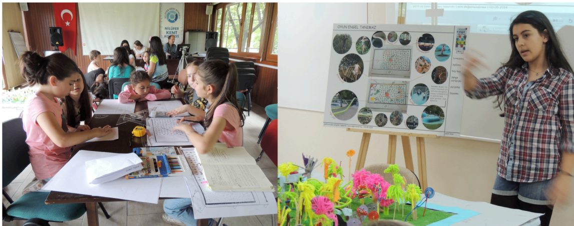
Resim 5: OET Eğitim Çalışmaları

engelsiz çocukların bir arada oynayabileceği bir oyun parkı tasarımını ortak bir üretimle ortaya çıkarmışlardır (Resim:6). Projenin ikinci etabında, tamamıyla çocuklar tarafından tasarlanan oyun parkının uygulamaya geçirilmesi süreci devam etmektedir. Proje paydaşlarının çeşitlilik göstermesi ve yerel yönetimin paydaşlardan biri olması projenin uygulanabilirliğini sağlamaktadır. OETP etkin bir yapıyı çevre eğitimi olmakla birlikte; çocuk ve gençlerin kentin yerel yönetim süreçlerine, kullanıcısı oldukları kentsel mekan tasarımına ilişkin kararlara dahil olabilme imkanı buldukları, demokratik yaşam kültürünün ve katılımcı kentli kimliğinin desteklendiği kolektif bir üretim platformu niteliği de taşımaktadır. Yapılı çevre eğitimi ile katılımcı tasarım anlayışının bir araya getirildiği bu model kullanıcının erken yaştan itibaren kentinin oluşumunda ve gelişiminde sorumluluk sahibi olmasını sağlamaktadır. Genç ve çocukların bu katılım mekanizmalarıyla tanışması ve aktif biçimde rol alması, bilinçli kentli figürünün oluşması adına büyük önem taşımaktadır. Katılımcı yönetim sistemlerinin sürdürülebilirliği ne genişlikte bir kitleye ne kadar erken ulaşılabildiğiyle doğrudan ilişkilidir. Bu bağlamda OETP “katılım” olgusunu yaş farkı gözetmeksizin toplumun geneline yaymakla kalmamış, sivil inisiyatifi etkinleştirme vizyonu taşıyan Nilüfer Kent Konseyi’nin gönüllü profilini gelişimine katkı sağlamıştır