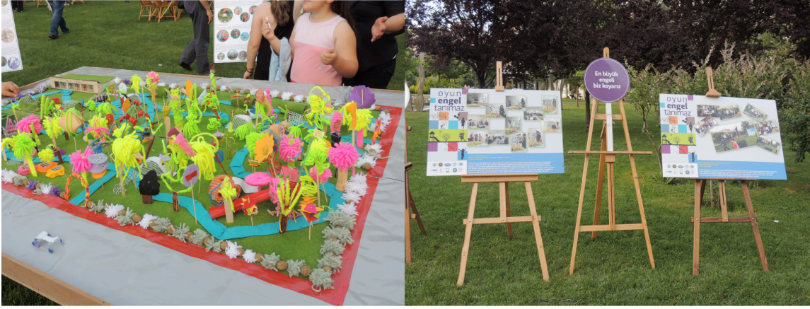
Resim 6: OET katılımcıları tarafından gerçekleştirilen park tasarımı SONUÇ

Kullanıcının yaşam çevresi ile iletişim kurabilmesi ve alınan kararlarda söz sahibi olabilmesi için yönetim politikasının bu yönde oluşturulması ve katılımcı yönetim anlayışının yaygınlaştırılması gerekmektedir (Baba, 2010). Birey, ancak bu sayede pasif tüketici kimliğinden sıyrılarak yapılı çevrenin biçimlenmesinde pay sahibi olan aktif bir kullanıcı kimliği kazanabilir. Kentsel tasarım gibi profesyonel yetkinlik gerektiren bir alan söz konusu olduğunda vatandaş katılımı çok farklı biçimlerde ve düzeylerde gerçekleştirilebilmektedir. Ancak, inisiyatifin tamamıyla vatandaşa geçtiği gerçekçi bir katılım sürecinin işlemesi çoğu zaman mümkün olamamaktadır. Bu sürecin sistematik bir çerçevede oluşturulması ve devamlılığının sağlanabilmesi için kent konseylerinin sunduğu potansiyellerin değerlendirilmesi gereklidir.