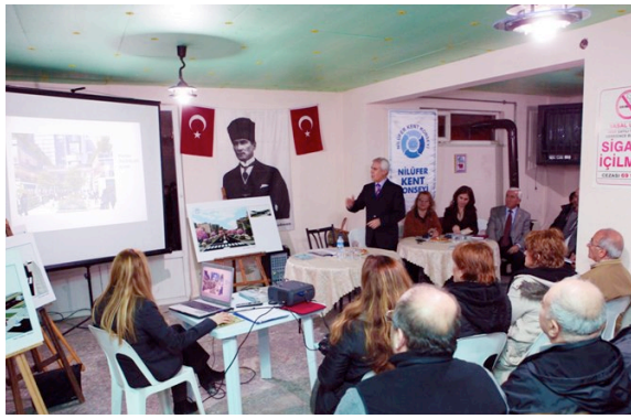
Resim 1: Mahalle Komitesi Toplantısı

edilmesi kararı alınmıştır. Yapılan anket çalışmaları ve yüzyüze görüşmeler sonunda mahalleli yolun daraltılmasını kabul etmiş ancak orta refüjün kaldırılmasını ve ağaçların kesilmesini reddetmiştir. Bunun üzerine Ulaşım Müdürlüğü, halkın isteklerine cevap veren ve teknik açıdan yol güvenliğini sağlayacak yeni bir çözüm üretmiştir. Caddenin bugünkü görünümü (Resim: 2) mahallelinin ortak kararı sonucu ortaya çıkmıştır. Mahalle Komitesi'nden çıkan kararın yerel yönetim tarafından uygulanmış olması katılımcı süreçler adına olumlu bir uygulamadır.