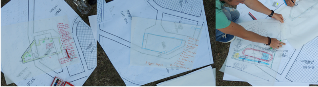
Resim 3: Kullanıcıların ihtiyaç programı önerileri

çalışma, farklı yaş gruplarından kullanıcıların bir araya gelip kendi ihtiyaçları doğrultusunda ortak bir proje oluşturmalarına imkan tanınması anlamında önem taşımaktadır.